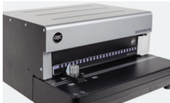
Couvercle métallique redessiné